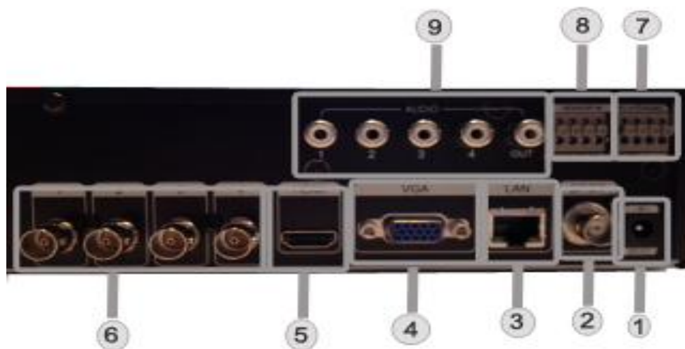
Illustration 2. Face arrière du DVR 4CH (4 canaux)