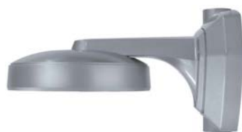
Fixation - étanchéité IP67 Réf : STB-280PW (en option)