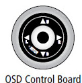
OSD Control Board