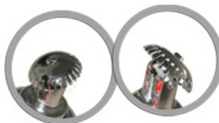
Sprinkler Head Adjustable